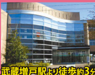
武蔵増戸駅より徒歩約3分